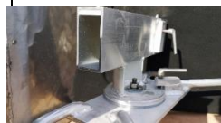
dreieskive med rigg oppheng.

Alle maskiner leveres uten svingkrans. Svingkrans med som lås og plate for å sveise fast oppheng til rigg leveres som tilleggsutstyr.