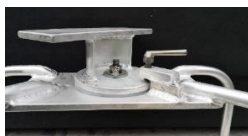
dreieskive m. sveiseplate

Alle maskiner leveres uten svingkrans. Svingkrans med som lås og plate for å sveise fast oppheng til rigg leveres som tilleggsutstyr.