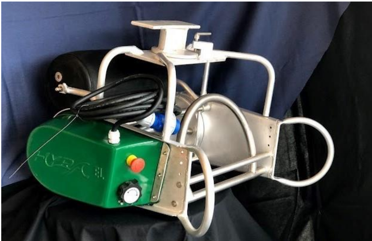
Hyra Minigarngreier 400EL 12V

Nb: Hyra Minigarngreier 400EL® er et elektrisk redskap. Sjekk alltid ledningen for skader/brudd ofte.