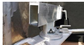
dreieskive med riggfeste

Alle maskiner leveres uten svingkrans. Svingkrans med som lås og plate for å sveise fast oppheng til rigg leveres som tilleggsutstyr. (Bilde1)